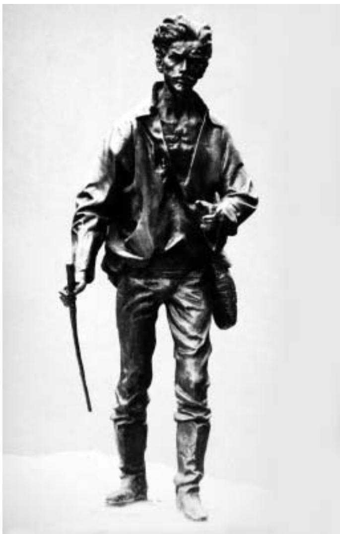
Vándor Petőfi (1988)