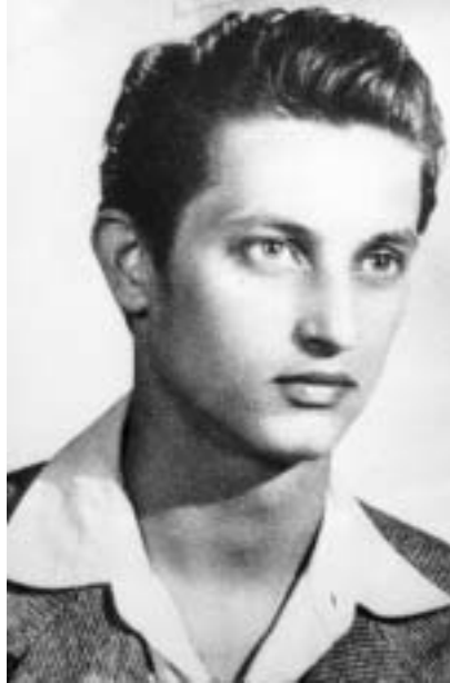
Még bizakodva néztem a jövőbe 1956 októberében...

1951-ben – 15 éves voltam akkor – vidéki diákokat toboroztak ipari tanulóknak. Pesten – a IV. kerületben, a Megyeri úton – a Kilián György Ipari Tanulmányintézetben laktam, és a Dohány utcai Általános Iskolában folyt az oktatás: köszörűsnek tanultam.