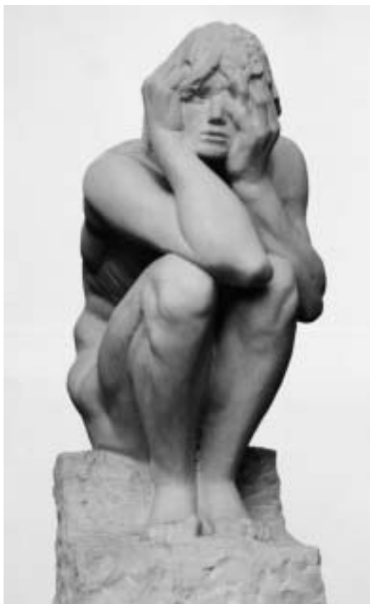
To be or not to be (1998)

És ettől kezdve Tolsztoj a végtelent a végesben, a transzcendenciát az immanenciában keresi, elmélyül a dogmatikus teológia tanulmányozásában, vallási témájú cikkeket ír felesége, Szofja Andrejevna legnagyobb bosszúságára, aki inkább férje irodalmi alkotásait kedvelte. És nem áll meg az „abszurd falaknál”, amelyeket jóval Camus előtt felfedezett. Egy szép napon, mindvégig ereje teljében, hűséges tanítványával, Dušan Makovickývel kora hajnalban elhagyja Jasznaja Poljanát, mert úgy véli, hogy ott nőttek fel azok a falak. Az egyszerre zseni és abszurd Tolsztoj ezzel az értelmetlen utazással teszi híressé – mintha nem volna semmi