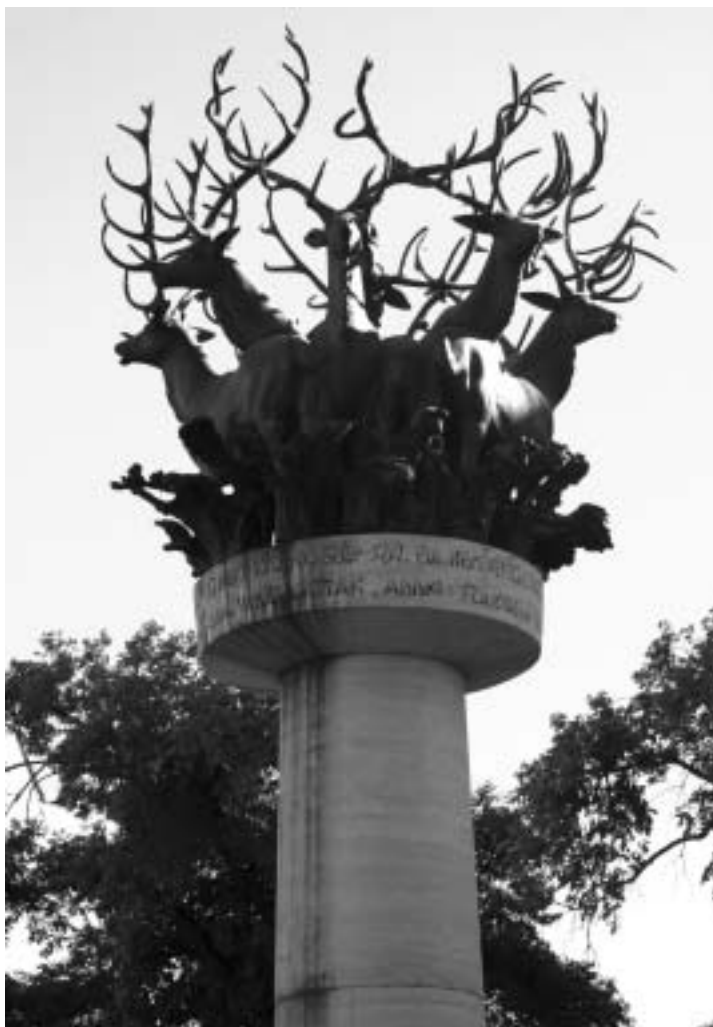
Cantata Profana (1992)