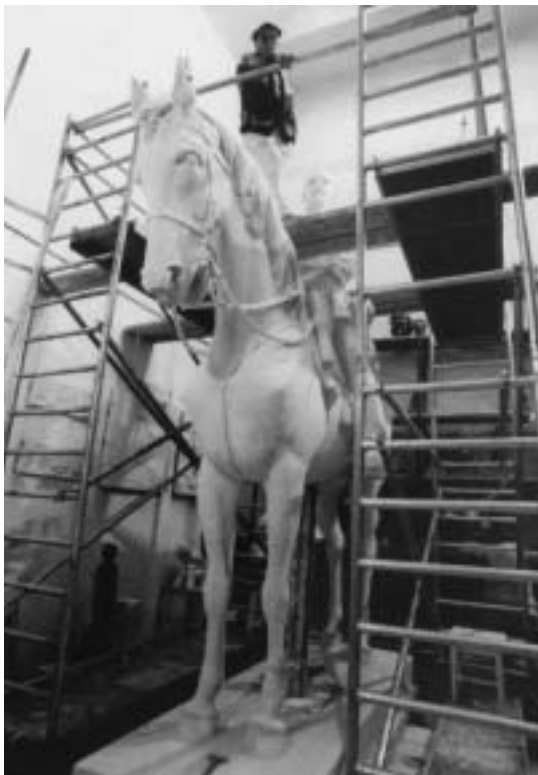
Műterem Görgy-szoborral (1997)

nak öltözött. A gyermekien közvetlen mozdulat, ahogy a korlátra ült, nem feltétlen tartozik ehhez a jelenethez, de az ilyen korú kisgyermek mozdulatárában megtalálható. Az ilyen hangvétellű szobroknak ezután nagy divatja kerekedett, elég végigsétálnunk a belváros utcáin, vagy vidéki városaink terein megfordulni, nagyon sok hasonló hangvétellű szoborral találkozhatunk.