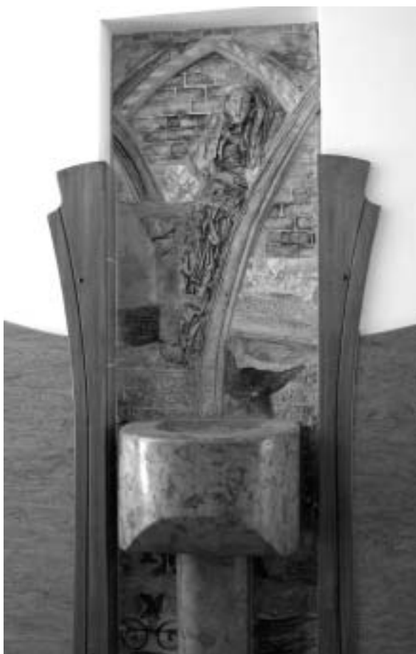
Mézesvölgyi Általános Iskola, ivókút (Vecsés)

Hányan ott hajlonganak, kotorásznak a lakótelepen túli fintorgó fóliaszennyben, hulladékok közt, mielőtt, ami hasznosítható belőle, végleg betemetődne.