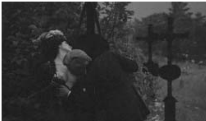
Szerelem a temetőben

A lilakalapos hölgy romantikus felbuzdulásában együtt szeretne meghalni Szindbáddal, de közben bevillan egy kép egy ablakban álló, kihívóan néző, meztelen nőről. Szindbád felfelé tekint, és a lila kalapos nő is arra néz. Sajnos hajnalodik, ezért a közös öngyilkosságot el kell halasztaniuk, és a lilakalapos nő hintóba száll. Ez az egyetlen igazán komikus és ironikus nő, illetve jelenet a filmben.