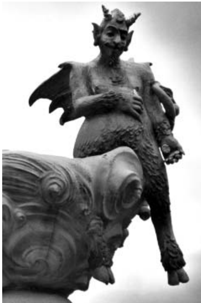
A jó és a Rossz (Kiskunfélegyháza)

felmágneseztelek öreg? ezt egy bevásárló kocsit toló pop-art kompozíciót megvalósító középkorú pár felett a téötös lelke kérdezte meg