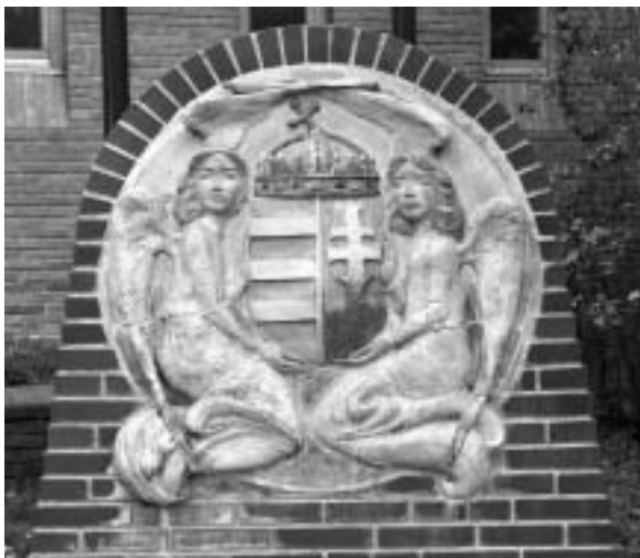
Mézesvölgyi Általános Iskola, Magyar címer (Vecsés)

E bírálat nem azt jelentette, hogy Németh – és a népi írók – igazságosnak tartották volna a trianoni határokat, és nem lettek volna tisztában a szomszéd