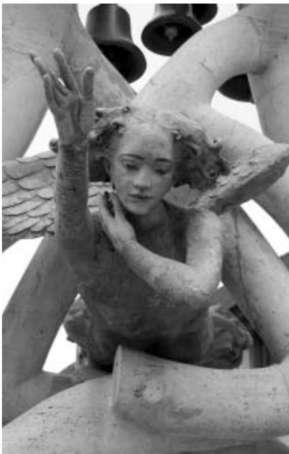
Zenélő kút (Veresegyháza)

nemzetállamok együttműködésének gondolata politikai rendezőelv lehet, nemcsak Magyarországon, de egyre többen képviselik ezt Európában is, gondoljunk csak a lengyelek kiállítására. Mindezt talán más mozgalmak mellett, a népi-nemzeti mozgalom önmeghatározásának, a lakiteleki találkozó és a harmadikutas ellenzék új dimenziókat és tereket nyitó, a civil társadalomra épülő legális ellenzéki politizálásának is köszönhetjük. Lakitelek értelmét Németh László 1943-ban mondott szavai idézik: „A végső cél ez lett volna: olyan radikális tábort állítani föl ebben az országban, amelynek nézeteit (s azokban a bennszülöttek valódi érdekeit) a ránk küldött megváltóknak is figyelembe kell venniük.” 5