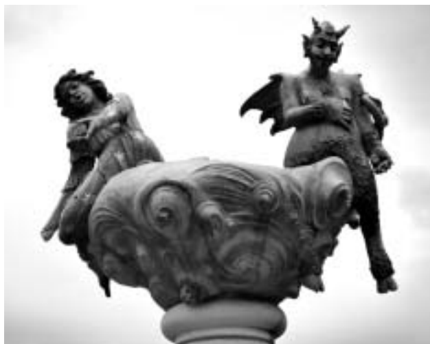
A jó és a Rossz (Kiskunfélegyháza)