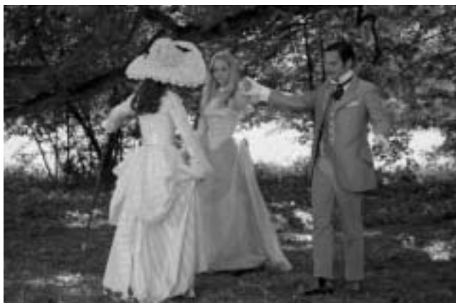
Francia „hármás”: francia négyes hármásban

Virág, olajcseppek a levesben, szárított virág, vércseppek vízben, zöld ág a havon, virág, virág a hajban, parázs, virág, szárított virág könyvben, régi fotó egy nőről, pókháló, fakéregbe vésett monogram („Sz. I.”), vízcseppek zsindeletető, virág csipkével, régi női fotó csipkével, régi lányfotó napraforgóval, vörös ruhadarab a havon, virág a pulóverben, erdős táj, régi női fotó fátyol mögött, előtte rovarral, napóra, vízcseppek zsindeletető.