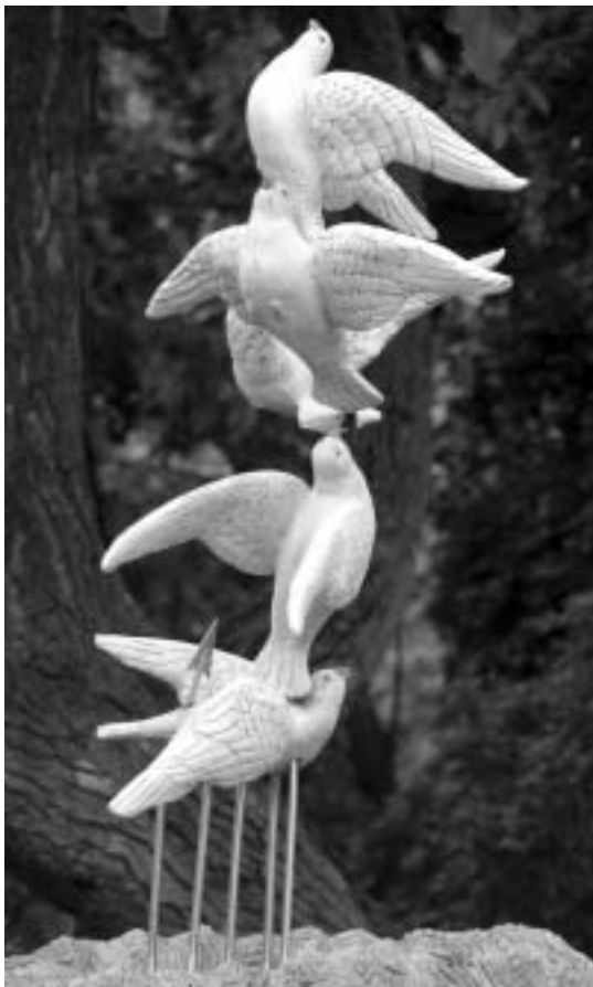
Összefogás emlékműve (Szada)