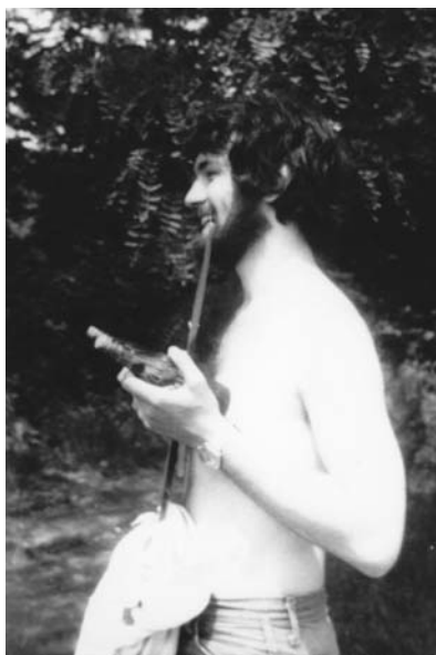
„Csapatkirándulás (Csikóvárалja, 1981)”

központi kérdés az identitás meghatározása, önmagunk keresése. A világjelenségek ellen mennyire tehet, ha legalább az íróember szembenéz önmagával?