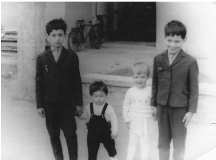
„Öcsémel, húgommal és unokahúgommal”

– A legerterjedtebb verzió, amiről én tudok, az, hogy a szinye-is diákok éppen a sarvasbögérsről tanultak, s mindenkinek a barcogás hangjával köszöntek. Csak egy tanár akadt, aki EÖ-zve köszönt vissza... Már