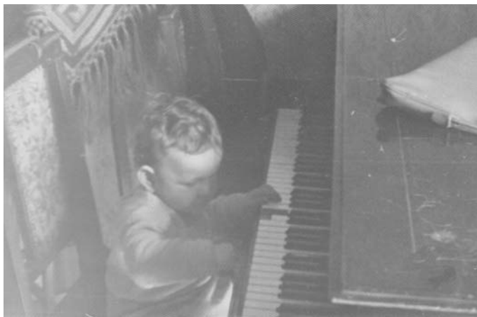
„Első zenei próbálkozások Szentgotthárdon”

– Gyermekkorban és fiatalon meghatározóak az olvasmányélmények, főleg annál, aki korán megtanul olvasni. Mikkor találkoztál ekkoriban,