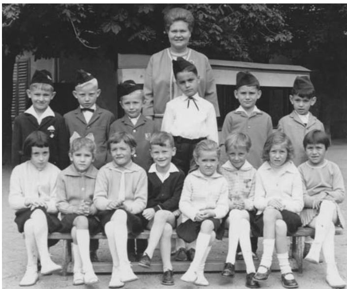
„Első osztályosként: az álló sor jobb szélén”

– Spirálisan, dupla spirálban forog a történelem. Úgy tér vissza, hogy mindig más arcban és új megfogalmazásban, de ugyanazt a tyúk vagy tojás kérdést tárja elénk. Egyfelől, hogy az egyén vagy a közösség a meghatározó, másfelől pedig saját hitelességének kérdését. De a történelem nem hiteles, folyton hamisítanak, mert hamisítani kell, hogy az emberiség fennmaradjon. Ugyanakkor mindig felbukkan valaki, mint Jézus Krisztus, de nemcsak ő, legyen az Szent Ferenc, Szent István, III. Béla, Zrínyi Miklós, Rákóczi Ferenc, Batthyány Lajos és jó barátja, Károlyi István, vagy Teleki Pál, akik mindig meg-